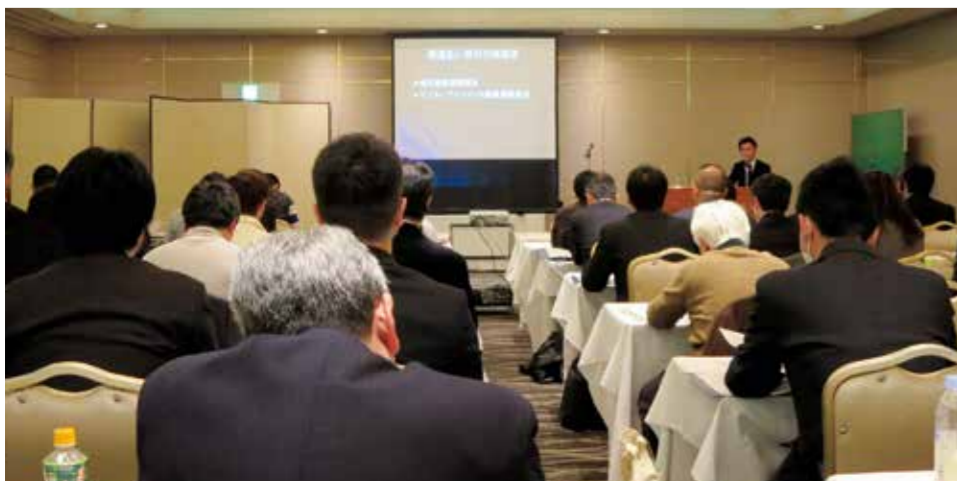
療養費等適正運用研修会